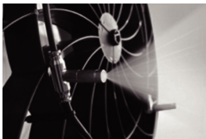
トルネード送風&ミスト噴霧